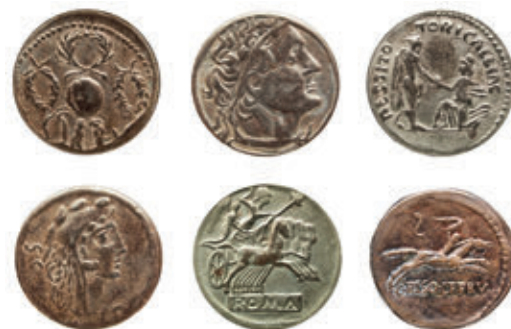
6. ábra – Pénzérmék