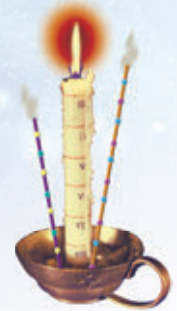
3. ábra – Időbeosztásos gyertya