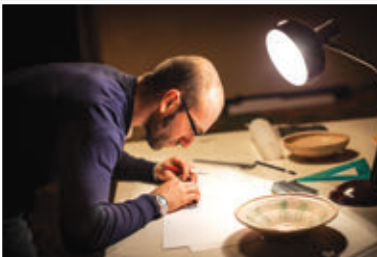
3. ábra – Régész a laboratóriumban