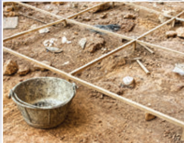
1. ábra – Régészeti ásatás