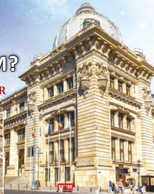
2. ábra – Románia Nemzeti Történelmi Múzeuma, Bukarest