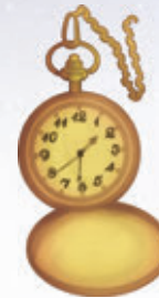
4. ábra – Mechanikus óra