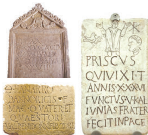
5. ábra – Feliratok

A történelmi források felkutatása a régészek feladata, ők előbb elvégzik az ásásokat, majd laboratóriumban elemzik a leleteket (1. és 3. ábra). Az így megszerzett információkat a történészek rendelkezésére bocsájtják. A legtöbb feldolgozott leletet múzeumban, könyvtárban vagy levéltárban őrzik (2. és 4. ábra).