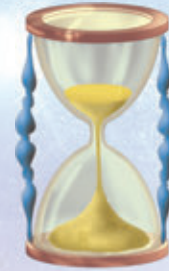
2. ábra – Homokóra