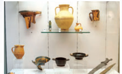
4. ábra – Történelmi értékű tárgyak