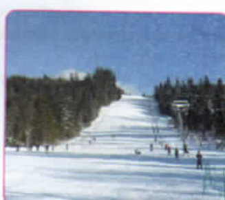
Pârția „Verofeny” 726m