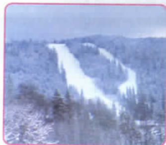
Pârția „Prichindelul” 814m

☆ Elevii clasei a II-a au hotărât să meargă în tabără, la schi. Agenția de turism le-a furnizat următoarele informații: