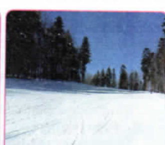
Pârția „Măgura” 530m

1. Care este ordinea crescătoare a lungimii pârtiilor?