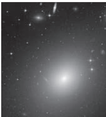
eliptică (ESO 325)