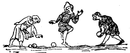
Jocul cu ghiulele