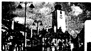
Sibiu – Piața Mare

4. Completați „Măpa de istorie“ cu imagini ale orașului Sibiu în Evul Mediu și în anul când a fost capitală culturală europeană.