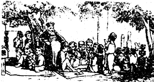
Copii învățând la începutul secolului al XIX-lea