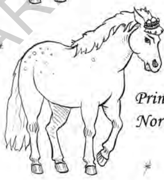
Prințesa Nor Alb