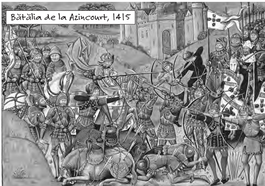
Bătălia de la Azincourt, 1415

nu aparțineau toți aceleiași religii. Se băteau pentru femeia iubită. Dar mai ales se băteau pentru a cuceri teritorii noi.